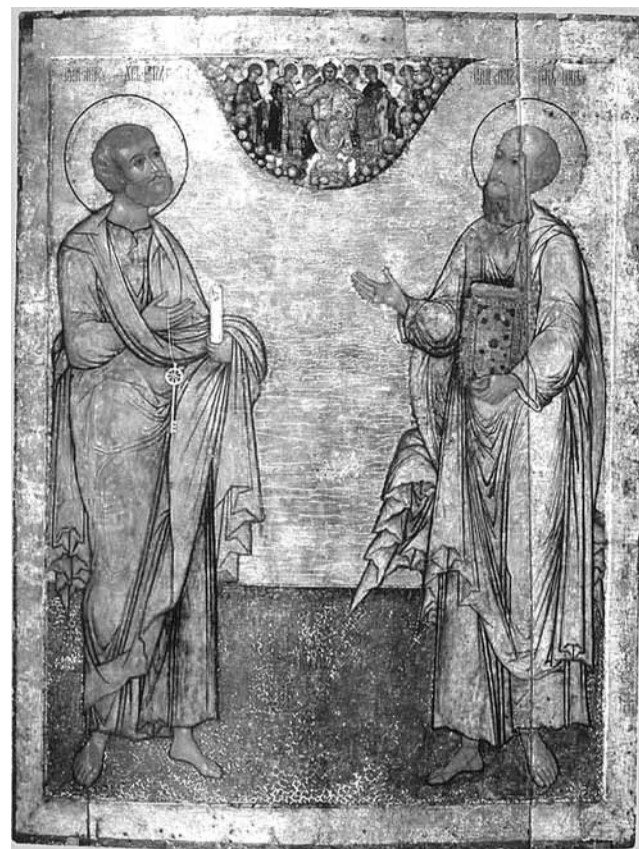
Святые апостолы Петр и Павел. (икона начала XVII века из церкви свв. Петра и Павла с. Слудка Ильинского района Пермского края).

Наша беда в том, что за две тысячи лет эти «немощные в вере» не исчезли; напротив, их голос стал решающим... Знаете, с этим когда-то надо кончать, нельзя всегда идти на поводу у бабушек и у их страхов. В конце концов, это и самих бабушек, и Церковь в целом сваливает в пропасть. Когда все