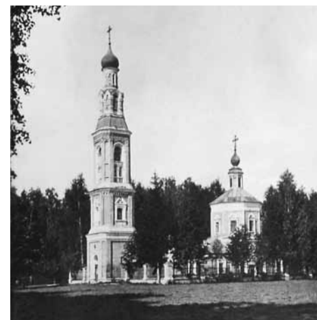
Газета «Коммунар», № 4 от 5 декабря 1933 г.

Несмотря на многочисленные перестройки, разрушения времен богоборчества и Великой Отечественной, Воскресенский Ново-иерусалимский собор сохранил образ храма града, как и было задумано патриархом Никоном. Королёвские паломники после службы приняли участие в крестном ходе вокруг церкви. Ознакомились со святынями храма — Камнем Миропомзания (копией иерусалимской святыни, на подобном камне ученики готовили Пречистое тело к погребению), темницей Господней, где находятя каменные Узы Христовы, Кувуклией Гроба Господня. Она расположена в центре высокой круглой ротонды, представляющей собой копию часовни животворящего Гроба Господня, существующей в Иерусалиме с XII века.