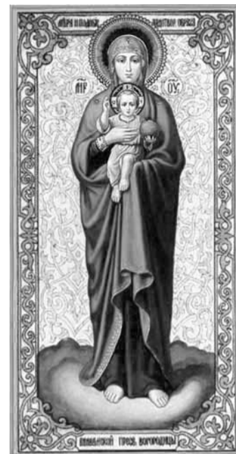
Валаамская икона Пресвятой Богородицы