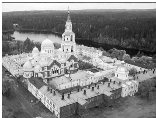
Оплот веры.

Продолжение. Начало читайте в предыдущем номере