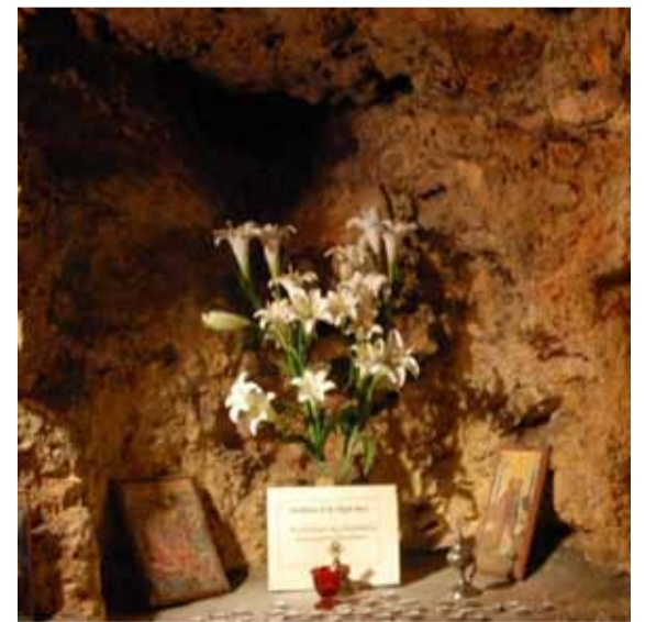
Место Рождества Пресвятой Богородицы

Несколько позднее греки стали строить здесь здание своего консульства и в нижнем этаже, с помощью России, создали скромную церковь Рождества Пресвятой Богородицы; церковь расположена направо от входа, за стеклянной дверью. Здесь же, направо, прямо