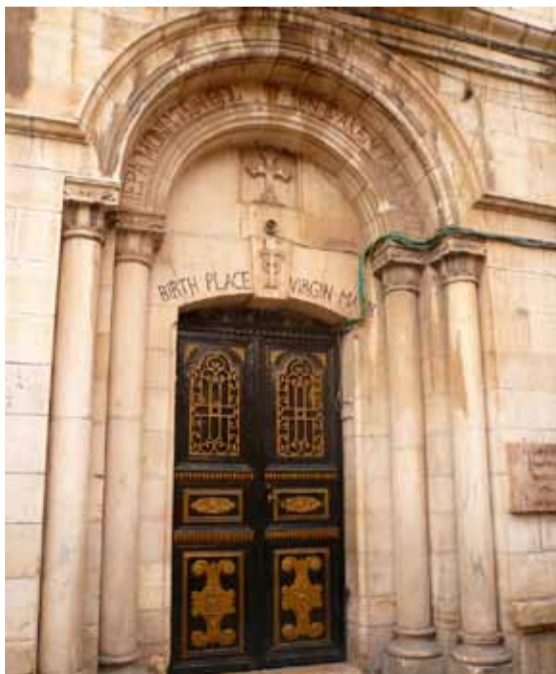
Вход в монастырь, построенный, по православному преданию, на месте дома святых Иоакима и Анны, в котором родилась Богородица. Старый город Иерусалима, около Львиных ворот. Принадлежит Иерусалимской православной церкви

По преданию, родители Пресвятой Девы жили в Иерусалиме, недалеко от Овчих (Львиных) ворот. На месте их дома св. Царица Елена построила храм, подвергшийся разрушению одновременно с другими. Неоднократно восстанавливаемый христианами после различных разорений, ко времени крестоносцев он представлял собою маленький бедный монастырь.