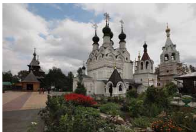
Свято-Троицкий женский монастырь в г. Муроме

В великий день Погребения Божией Матери мы отправились в Муром, к благоверным князьям Петру и Февронии, посетили храм Николая Набережного, где почивают мощи праведной Иулиании. Поклонились и чудотворному образу Божией Матери «Скоропослушницы».