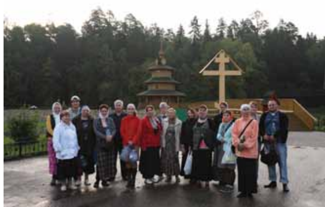
У источника прп. Серафима Саровского

Меж тем Канавку Божией Матери украсили цветами. Крестный ход сестёр монастыря идёт по цветочному ковру с Богородичными иконами. По