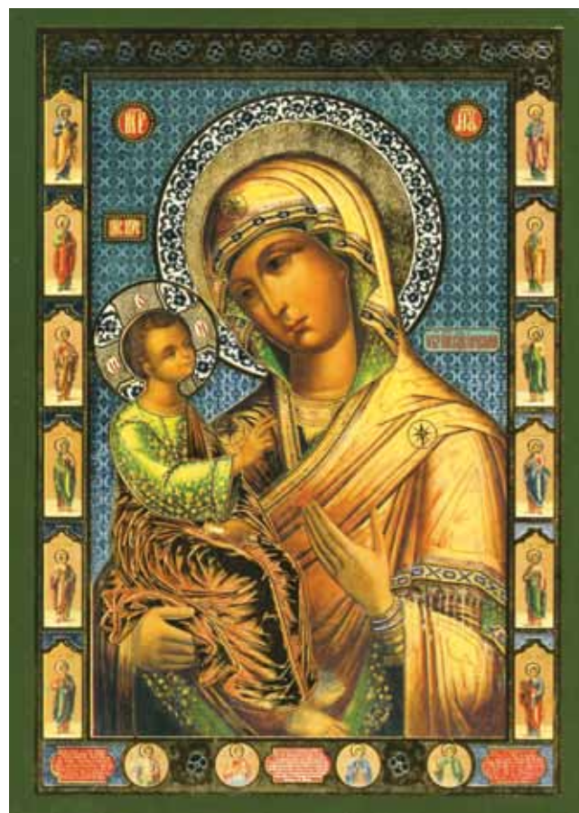
Иерусалимская икона Божией Матери

Иерусалимская икона Божией Матери, по преданию, была написана в 15-й год по Вознесении Господнем, в Гефсимании, и была первой из всех образов Богородицы, созданных святым Евангелистом Лукой. Предназначалась икона для иерусалимской общины. По некоторым свидетельствам, именно этот образ, находившийся некогда в храме Воскресения Христова в Иерусалиме, явился той чудотворной иконой Богородицы, от которой изшел глас к преподобной Марии Египетской, обративший ее от греховного пути.