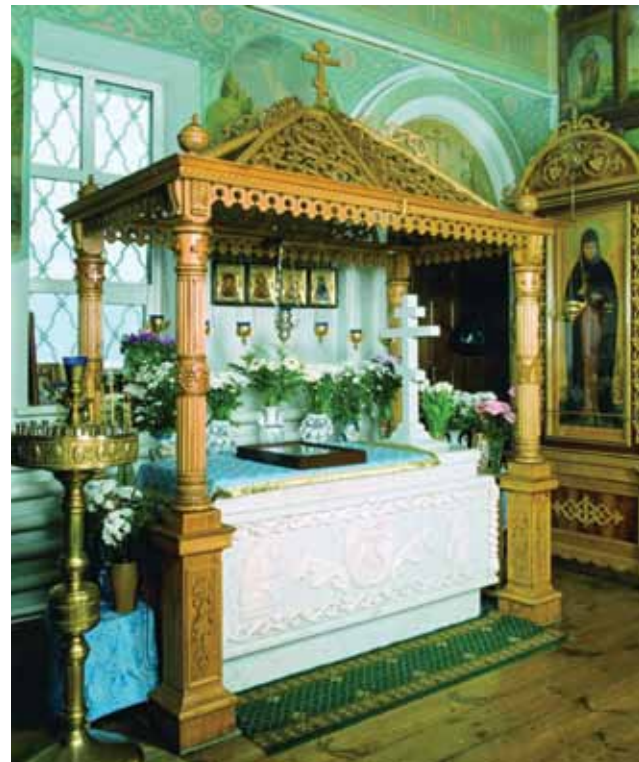
Рака над мощами блж. Евфросинии в церкви Казанской иконы Божией Матери в Колопановском монастыре

Подвиг юродства Христа ради — самый тяжелый подвиг стяжания святости. Старица Евфросиния питалась лишь хлебом да квасом, спала — самую малость — на голых досках, носила на шее тяжелую железную цепь и непрестанно молилась. Она обладала даром прозорливости. Блаженные часто прозревали будущее, являя это и своим внешним видом. Евфросиния, например, остригла волосы, словно зная, что придет время, когда девушки, женщины лишатся своих кос. Вместо них нынче — модные стрижки... А ведь коса — «девичья краса», честь и достоинство женщины! Старица Евфросиния к тому же ходила в штанах, как мужчина. И вот сейчас чуть ли не все женщины носят брюки, джинсы. А ведь мужская одежда для женщины — «мерзость перед очами Господа»! Разве невеста наденет брюки? Слава Богу, этого еще нет. На венчание принято облачаться в белое платье, символ чистоты и непорочности. Но, возможно, скоро появятся и невесты в брюках! Да что молодежь, сколько старушек ходит в штанах, объясняя, что так теплее! А ведь тысячи лет Православная Русь носила красу-сарафан.