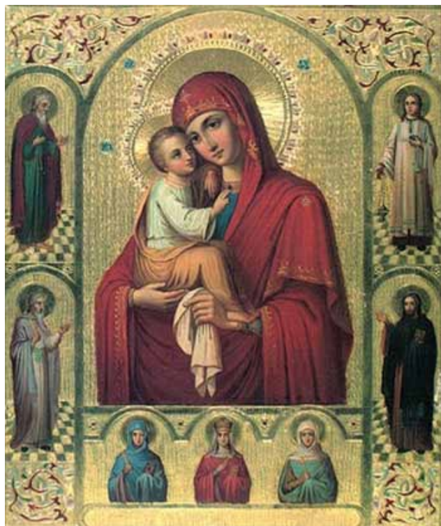
Чудотворная икона «Всех скорбящих Радость» в Преображенском храме на Ордынке в Москве.

Не часто людям случается доставить радость даже близким своим. Сколько же надо любви, милости и силы, чтобы доставить радость всем? И кто может горе, скорбь людей переменить на радость? Святая Церковь свидетельствует, что Божия Матерь Единая есть в этом Помощница. Издавна православный народ с любовью называет Ее – Радостью все скорбящих. «Не имамы иныя помощи, не имамы иныя надежды, разве Тебе, Владычице». На твердой и глубокой вере в Небесное предстательство Божией Матери, на многочисленных свидетельствах благодатной помощи Пресвятой Богородицы всем, с верой прибегающим к ней, и основан освященный Православной Церковью обычай писать иконы «Всех скорбящих Радость». Божия Матерь изображается на этих иконах обычно во весь рост, иногда с Предвечным Младенцем на руках. Главную особенность икон «Всех скорбящих Радость» составляет изображение на них людей, страждущих от болезней или скорбей житейских. Между страждущими часто изображаются Ангелы, раздающие благоденствия от имени Богоматери. В свидетельство безграничной милости Пресвятой Богородицы и твердого упования в заступничество Ее за православных христиан, в разных местах икон помещаются слова из молитвы к Божией Матери: «Алчущих Кормительнице», «Нагих одеяние», «Больных исцеление» и др. Одна из таких икон прославилась в Москве 24 октября 1688 г.