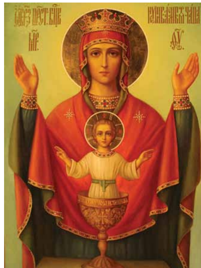
Икона Божией Матери «Неупиваемая Чаша»

Чудотворная икона Божией Матери «Неупиваемая Чаша» была явлена во Владычнем монастыре города Серпухова в 1878 году.