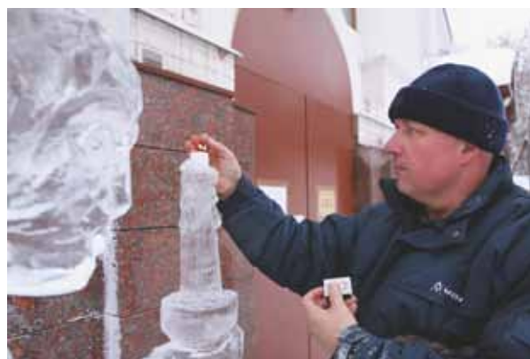
Лед и Пламя