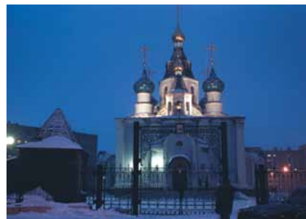
Храм Всех Скорбящих Радость

Об этом особо. Хотя стройка была обеспечена с помощью комбината самой современной техникой, имела в ней и «ручная часть»: воздвижение креста на купол. Не знаю, как это получилось, но