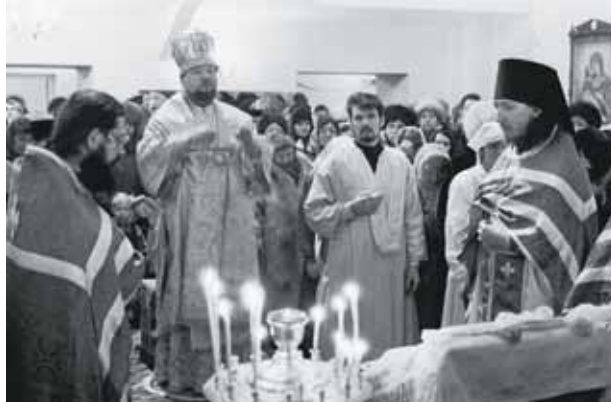
Освящение храма Всех Скорбящих Радость

стояли энтузиасты-прихожане. Владыка Питирим благословил их. Он специально приехал для этого в заполярный город.