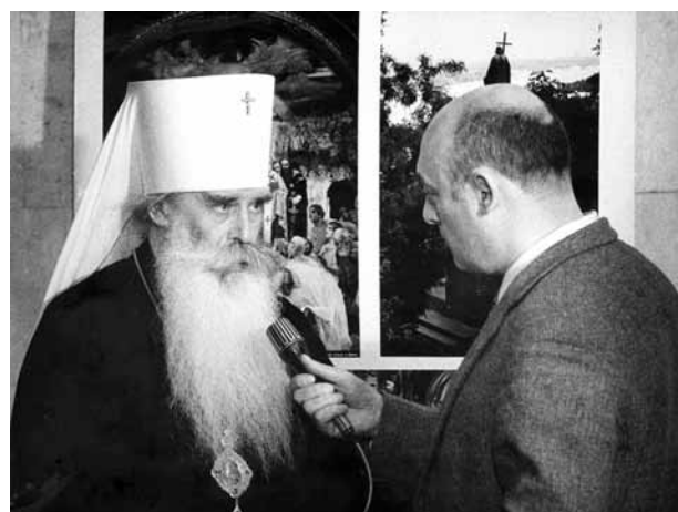
Митрополит Волоколамский и Юрьевский Питирим 21 февраля 1990 г. дает интервью корреспонденту Гостелерадио СССР В.Кравцу

МИТРОПОЛИТ ВОЛОКОЛАМСКИЙ И ЮРЬЕВСКИЙ ПИТИРИМ: «Это дверь, открытая в вечность. У нас в Москве был замечательный митрополит Трифон, который говорил: Дети, любите Храм Божий, ибо – это земное Небо. Храм – это напоминание о вечном, гдеживает душа и пробуждается совесть. Те неисчислимые жертвы, которые были принесены и заложены в основу этого сейчас, я бы сказал, прекрасного процветающего города, принесены не зря. Сейчас для меня большая радость быть в Норильске и видеть, как этот новый город начинает приобретать и духовное содержание, именно религиозное, не только той высокой духовной культуры, которую я наблюдаю в людях, школах, в театре. Очень хороший приветливый народ. Так что жертвы принесены не зря.