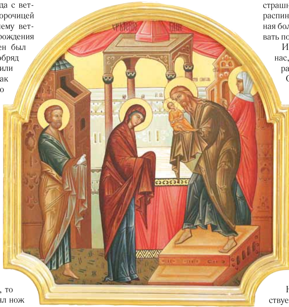
Икона Сретения Господня из иконостаса верхнего храма

Радуйся, Благодатная Богородице Дево, из Тебе бо возсия Солнце правды, Христос Бог наш, просвещающий суция во тьме. Веселися и ты, старче праведный, приемый во объятия Свободителя душ наших, дарующаго нам воскресение.