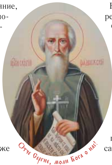
Отче Сергие, моли Бога о нас!

Таким образом, от нас самих зависит всё наше будущее. От того, что мы возьмём с собою в вечность. Причём всё определяют дела злые, как управимся с ними ещё здесь, на земле. Покаемся или не покаемся? И как покаемся. Можем ли мы представить себе картину: ребенок разбил чашку. Шалил, уронил на пол и разбил. Ребенок в таком возрасте, что уже понимает: плохо поступил. Подходит к маме и говорит: «Прости меня, мама. Я согрешил делом, словом и помышлением». Что тут ответит мама? Простит ли ребенка? А ведь он сказал истину!