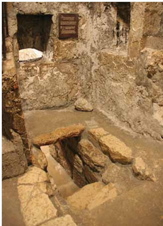
Гробница Лазаря Четверодневного

После Вифании мы поспешили в свой храм в Горнем и торжественно справляли Вход