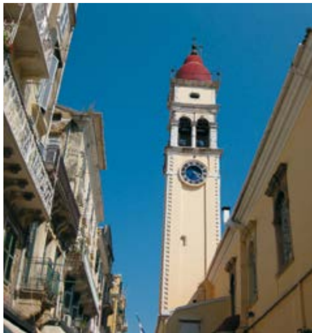
Колокольня святителя Спиридона (о. Корфу)

Удалось нам посетить и храм святителя Спиридона Чудотворца, расположенный в городе Керкира, крупнейшем на острове Корфу.