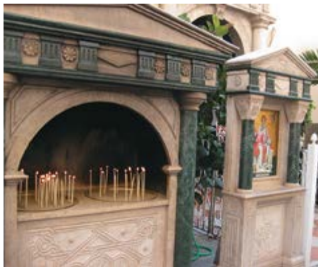
У входа в храм святителя Спиридона (о. Корфу)