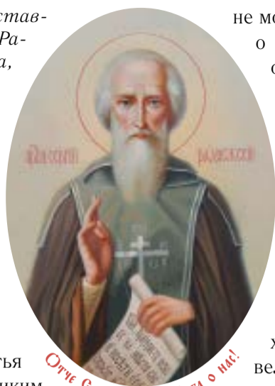
Отче Сергие, моли Бога о нас!

8 октября 2012 года, в день преставления преподобного Сергия, игумена Радонежского, всея России чудотворца, Святейший Патриарх Московский и всея Руси Кирилл совершил Божественную литургию в Успенском соборе Свято-Троицкой Сергиевой лавры и молебен преподобному Сергию на площади Лавры. По окончании молебна с балкона Патриарших покоев Предстоятель Русской Православной Церкви обратился к участникам торжеств с Первосвятительским словом.