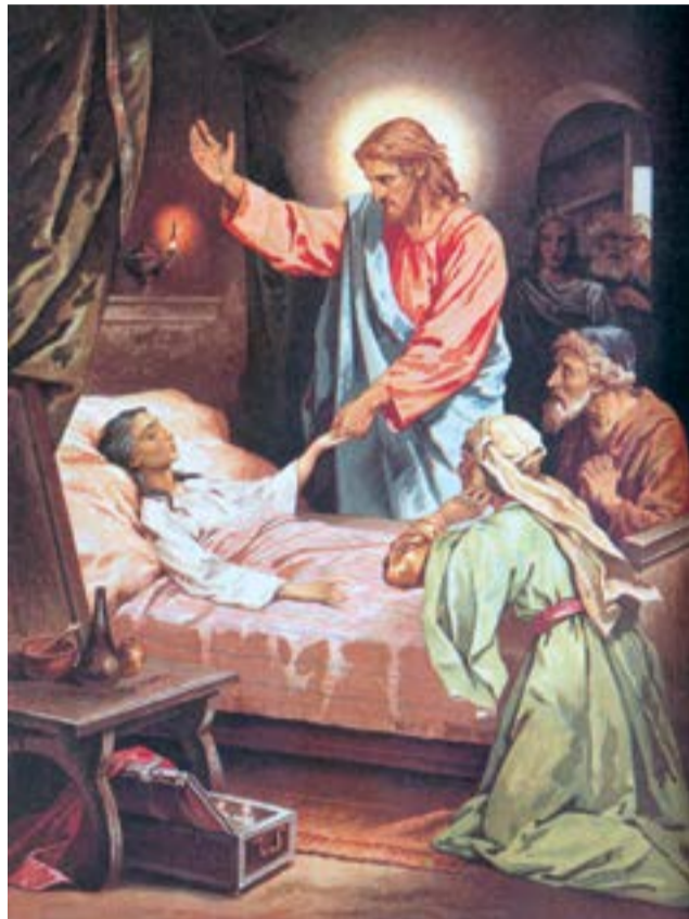
Воскрешение дочери Иаира

Но как верить чудесам? Ведь «чудеса» совершали язычники, маги и колдуны. Господь даже предостерегал учеников: «Востанут лжехристы и лжепророки и дадут великие знамения и чудеса, чтобы прельстить, если возможно, и избранных» (Мф. 24, 24). Мёртвых будут воскрешать, больных исцелять. Но «не верьте