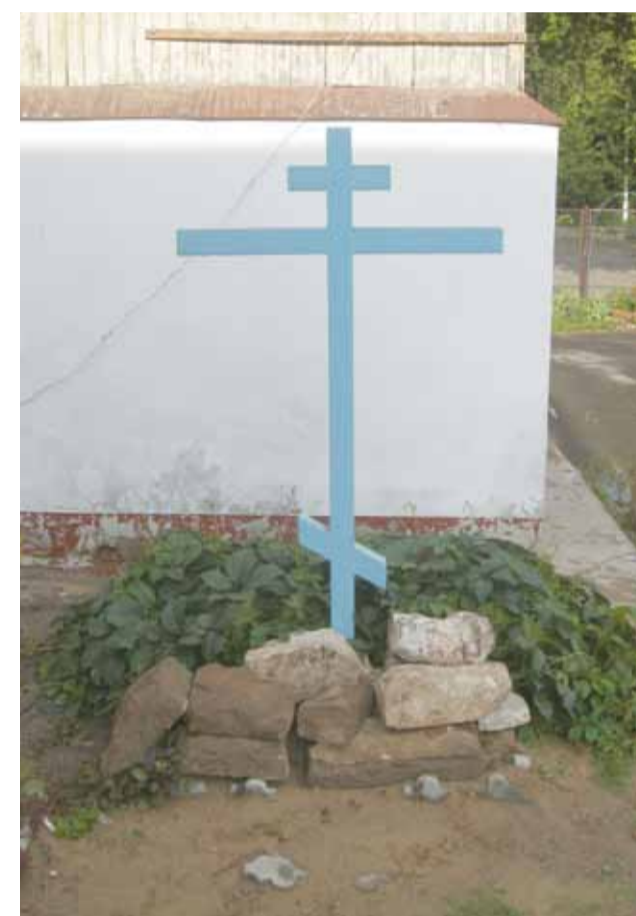
Элементы кладки разрушенной Богородицерождественской церкви, 12 июня 2013 г.

– Что ж, камни теперь нашли место своего вечного упокоения: в церковной ограде возрождённого храма, у основания Креста. Символично, что произошло это накануне нашего 10-летия. Нельзя на месте разрушенной церкви и церковного кладбища, не проведя тщательного археологического обследования, затевать хаотические строительные работы. Благодарение Богу, мы живём не в послереволюционные годы. Нынешнее время ознаменовано повсеместным духовным подъёмом, расцветом Православия. Но, к сожалению, не в нашем городе.