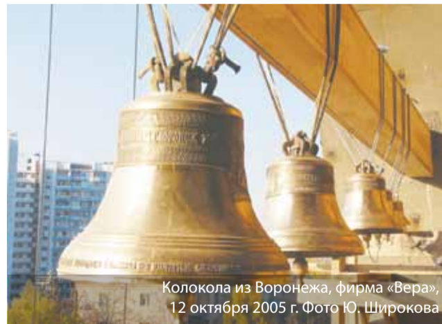
Колокола из Воронежа, фирма «Вера», 12 октября 2005 г.

К нам лес «пришёл» от северян. Кирпич купили в Ярославле, В Воронеже — колокола. Работали «Электросети», «Хлебозавод», «Водоканал».