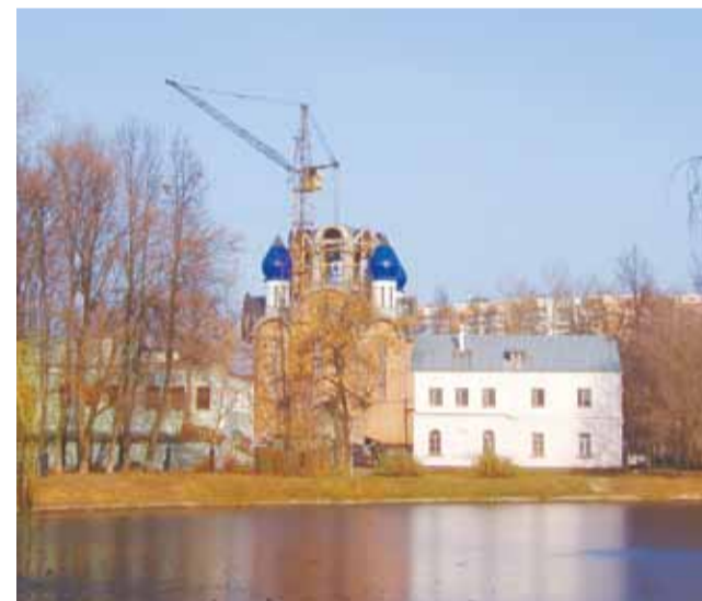
Строительный сезон 2005 года.

Уже 9 октября 2005 года, в день святого апостола и евангелиста Иоанна Богослова, в нижнем храме состоялась первая Божественная литургия. 11 ноября 2005 года над построенным храмом вознёсся Крест. Таким образом, с начала строительства прошло всего три года, из которых чистого строительного времени было 15 месяцев. А ведь храм строился на пожертвования прихожан и при бескорыстной помощи некоторых городских предприятий в виде строительной техники и транспорта.