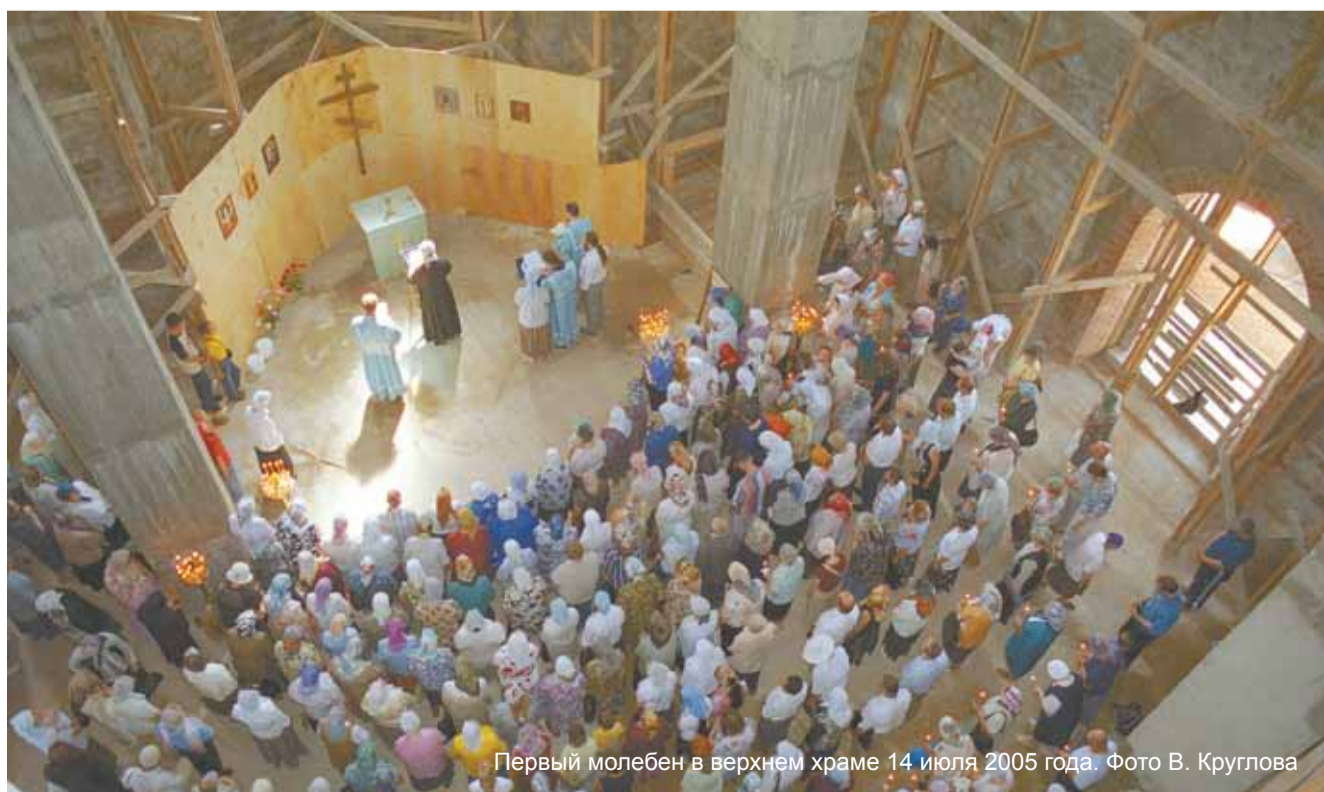
Первый молебен в верхнем храме 14 июля 2005 года.