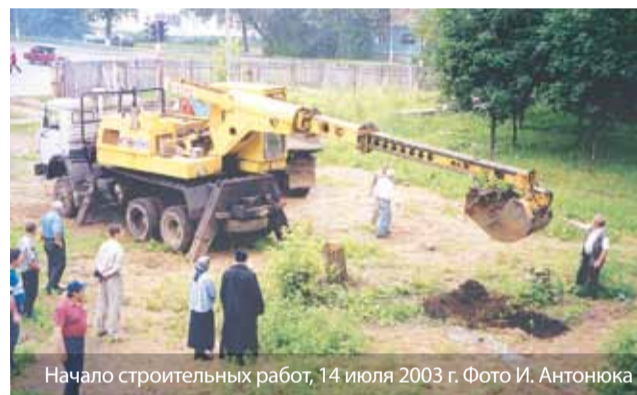
Начало строительных работ, 14 июля 2003 г.

В архивах: 33 гектара Земли церковной, а сейчас 15 на 15 метров... Там Богородица ждёт нас.