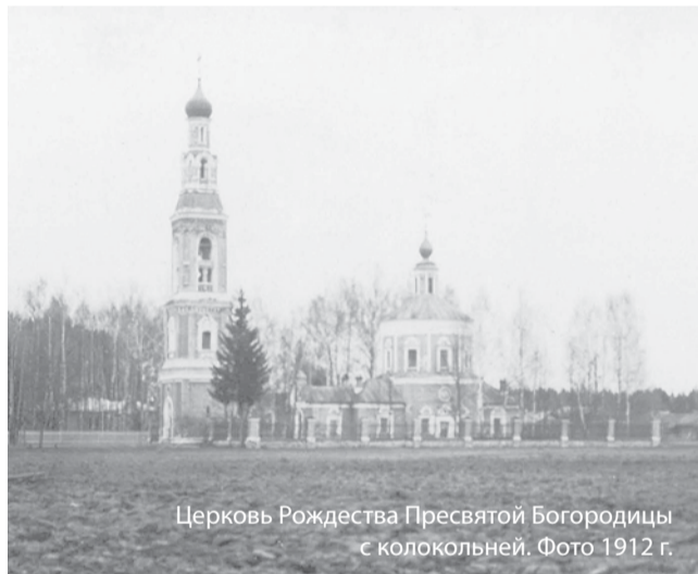
Церковь Рождества Пресвятой Богородицы с колокольней. Фото 1912 г.