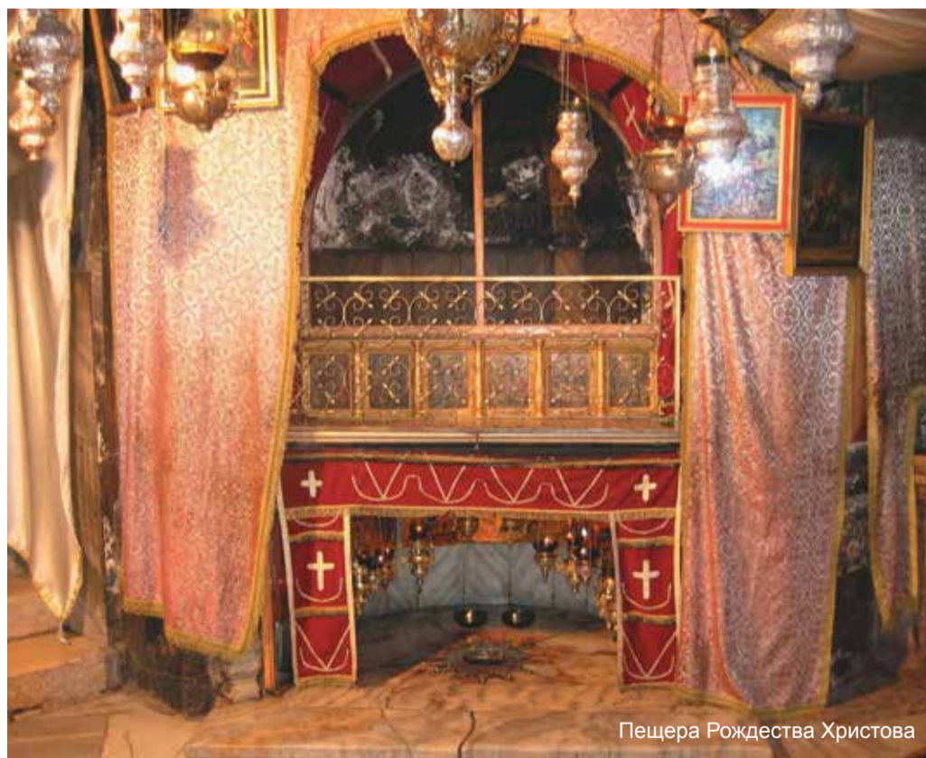
Пещера Рождества Христова

Дорогие прихожане! Своими впечатлениями о паломнических поездках вы можете поделиться на страницах нашей газеты.