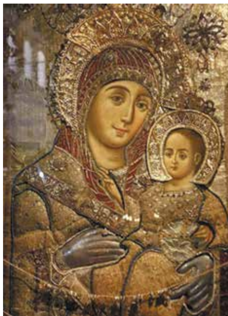
Икона Божией Матери «Вифлеемская»

Ранним утром (было ещё темно) мы приехали в базилику Рождества Христова на Божественную литургию. Это один из самых древних храмов Святой Земли. Базилика построена над пещерой, в которой родился Иисус Христос. Сама Пещера, Святой Вертеп расположена под алтарной частью. Низко нагибая голову, мы спустились по правой узкой лестнице в Пещеру, где сразу увидели святое место, украшенное пятнадцатью серебряными лампадами — они подарены разными конфессиями. Лампады подвешены над серебряной звездой,