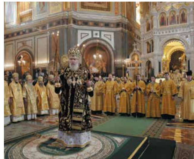
16-летие интронизации Святейшего Патриарха Алексея, 8 июня 2006 г.

Силы добра и зла схлестнулись во мне (или из-за меня?), решая, чьей добычей мне стать. А я понял: была победа. Патриарха. Бога.