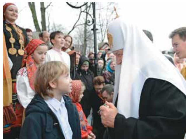
Разговор с Патриархом

своих проблем много, поэтому, может быть, какие-то проблемы Сирии людям кажутся третьестепенными на фоне того, что у нас происходит в детских домах, в домах для престарелых.