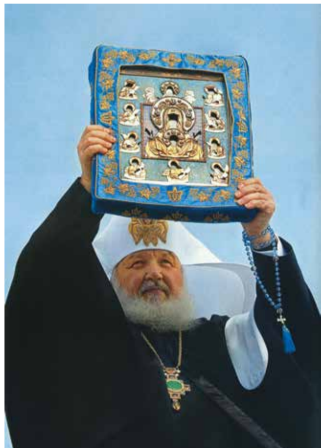
Благословение иконой «Курская-Коренная»

И вот эти огромные наши приходы (это ещё вопрос к тому, почему нужно больше приходов), многотысячные приходы не дают возможности организовать подлинную христианскую общину, где, в том числе, присутствовала бы и забота о нуждающихся внутри самой общины.