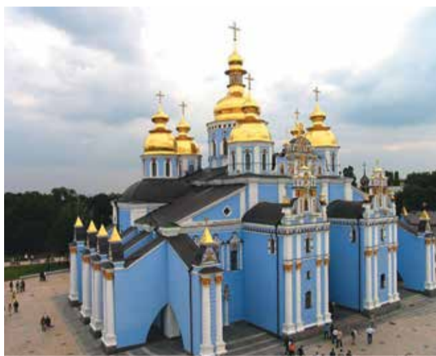
Михайловский Златоверхий собор

Михайловский Златоверхий монастырь — ещё одна древняя святыня. Первая церковь была построена на этом месте ещё в XII веке. По преданию, это был первый храм с золочеными куполами, отсюда и пошла эта русская традиция. Нынешний вариант в стиле украинского барокко поражает своей помпезностью и роскошью. При большевиках собор взорвали и только 10 лет назад восстановили.