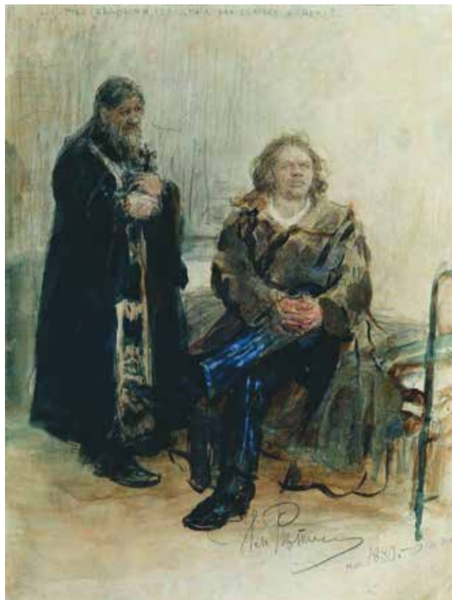
И.Е. Репин. Отказ от исповеди. Начало 1880-х

Как только зародилась гордость — тут же вылезают и зависть, и тщеславие и желание затмить всех. Человек начинает превозноситься сначала над ближними, а там уже и над всем окружающим миром.