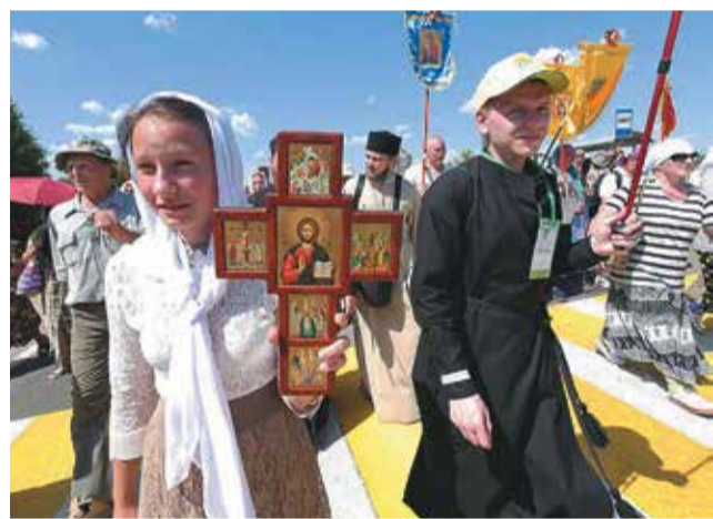
Паломники со всей России

Было жарко. Те, кто вышел из монастыря в голове Крестного хода, начали перемещаться к середине, а потом уже и концу колонны. Это были в основном бабушки, которые приехали в монастырь заранее и отстояли службу.