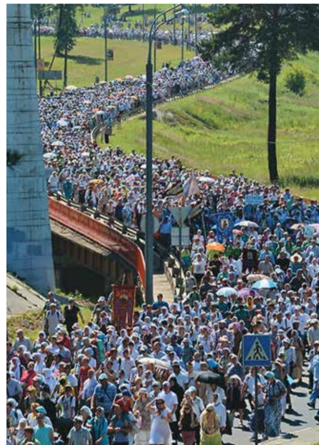
Людская река к Преподобному

По обочине дороги стояли волонтеры, одетые в футболки салатного цвета. Они смотрели, не нужна ли кому помощь. Вызывали скорую, если кому-то стало плохо. Ведь в тени было 35 градусов! С помощью Божией и молитвами преподобного Сергия мы держались. Вот обогнал меня папа, неся на спине сына 8-9 лет, вот мама с коляской, вот инвалид на костылях. Дети, пожилые, старые и очень старые шли, изредка останавливались, пили воду, умывались у колонок. Всё-таки очень жарко! Но тут нам пришла помощь: горожане (я говорила, что мы шли мимо одноэтажных домов) вытянули со своих участков шланги с распылителями и орошали нас. Слышался смех, весёлые возгласы, слова благодарности. В воздухе висела маленькая радуга!