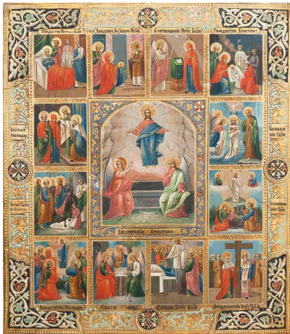
Икона «Воскресение Христово с праздниками», конец XIX — начало XX вв.

С верой в Воскресение Христова неразрывно сопряжена и вера Церкви в то, что воплотившийся Сын Божий, совершив Искупление рода человеческого, разорвав оковы