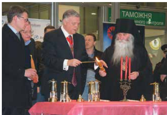
В аэропорту Внуково