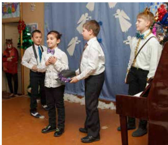
На сцене - Честолюбец