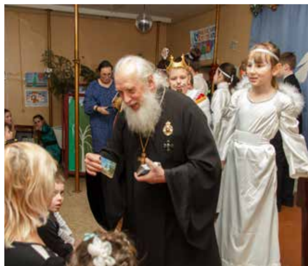
Подарок от батюшки

Рождество Твое, Христе Боже наш, возсия мирови свет разума, в нем бо звездам служащи звездою учахуся Тебе кланяться, Солнцу правды, и Тебе ведети с высоты Востока. Господи, слава Тебе!