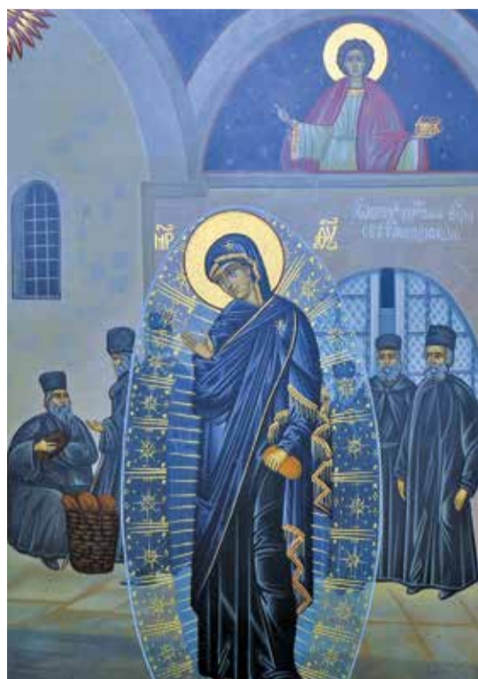
Образ Божией Матери «Светописанный»

Здесь надо заметить следующее. Нельзя смотреть на Афон, как на место, где одни только ангелоподобные монахи, бессребреники, отказавшиеся от всего мирского. Афон всегда был ещё и местом, где могли скрываться, и скрывались, от правосудия, убежавшие из-под стражи преступники, просто лодыри, не желавшие работать, молодые люди, убежавшие от обязанности службы в армии, — словом, дармоедов, а как их ещё назвать, хватало. Но — все Божии создания, ко всем был милосерд монастырь. От старцев Протата пришло в монастырь увещательное послание прекратить обычай раздавания хлеба. Объяснялось это так: «Милостыня,