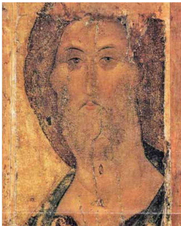
«Спас» из Звенигородского чина. Андрей Рублев

Так вот, только тот, кто нелицемерно полюбил Бога, войдёт в Царство Небесное.