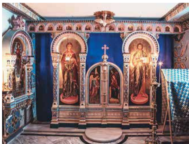
Иконостас храма в честь Светописанного образа Богородицы в Русском Пантелеимоновом монастыре

В Свято-Пантелеимоновом монастыре на Афоне действует храм, посвящённый Светописанному образу Божией Матери.