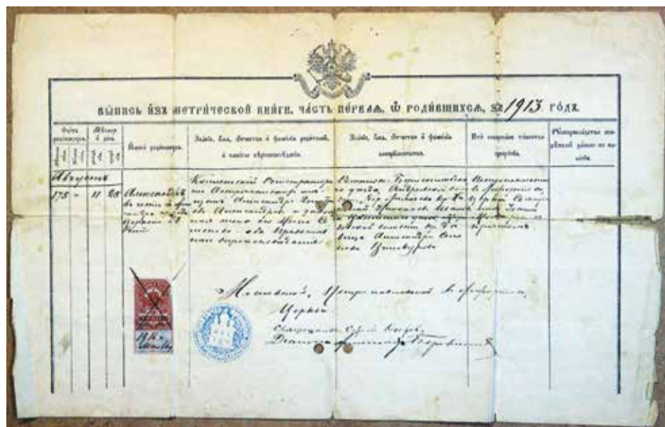
«Выпись из метрической книги», выданная в 1916 году