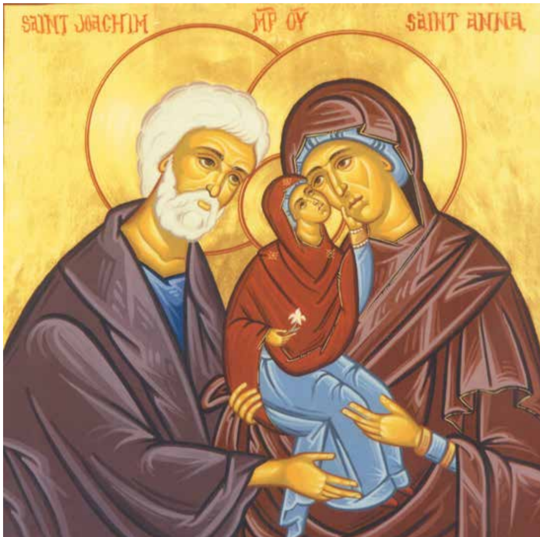
Икона праведных Иоакима и Анны с Пресвятой Богородицей

И вот, будем радоваться и унесём радость сегодня из этого храма — не только на одно мгновение: будем её хранить изо дня в день, будем изумляться этой радости, будем ликовать этой радостью и станем эту радость