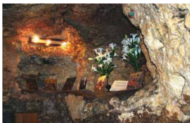
Место Рождества Пресвятой Девы Марии

Дом, где жили праведные Иоаким и Анна и где появилась на свет Пресвятая Дева,