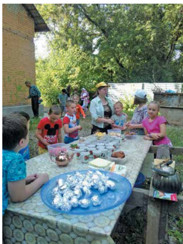
Пикник, 22 августа 2017 г.