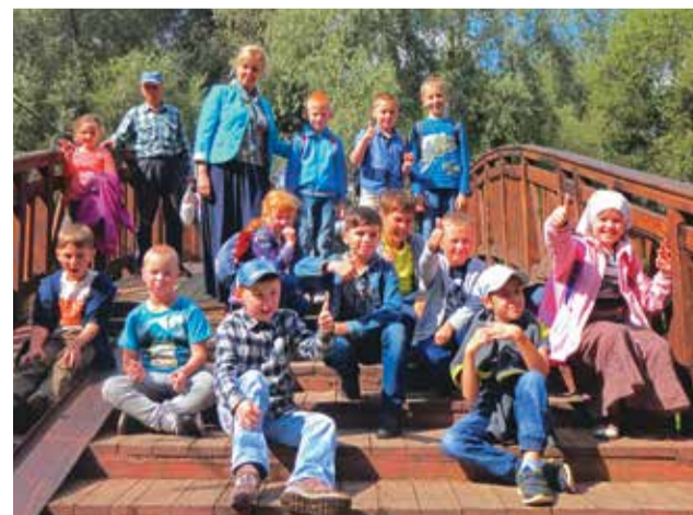
В усадьбе «Свиблово», 24 августа 2017 г.