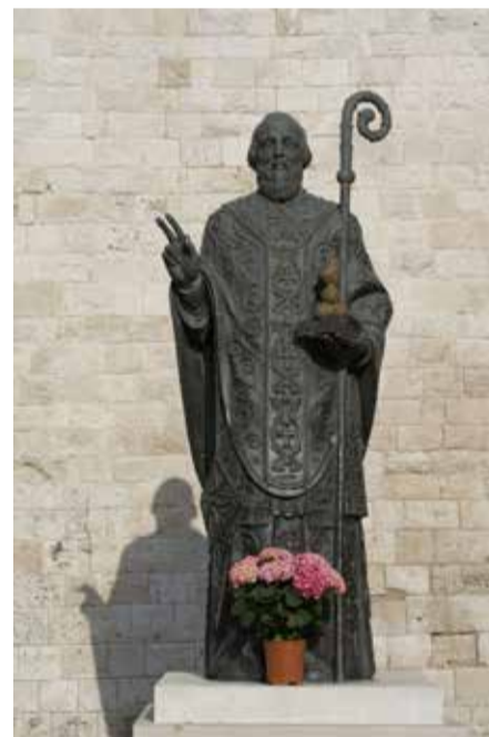
Памятник святителю Николаю в Бари

Из Черногории на пароме мы переправились в Италию, в город Бари. Основной целью было, конечно же, посещение часовни с мощами Николая Чудотворца. Хранятся они в красивой базилике XVIII века.