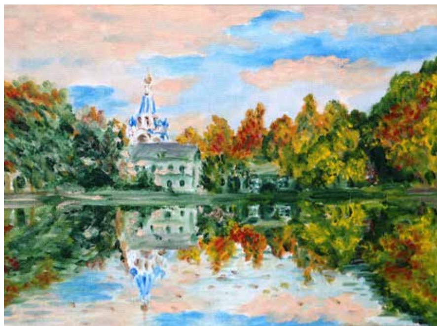
«Храм в Костино», 2017 год