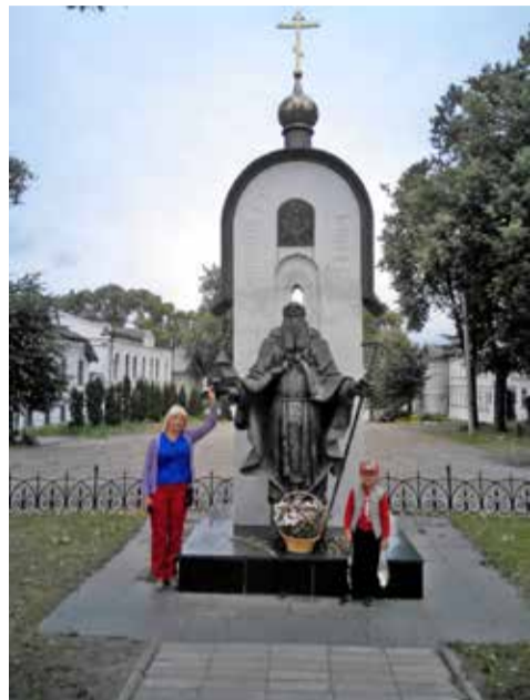
У памятника свт. Макарию Калязинскому

Главная достопримечательность Калязина, колокольня Никольского собора (1796-1800), стала достопримечательностью после совсем невесёлых событий: затопления Угличским морем большей части