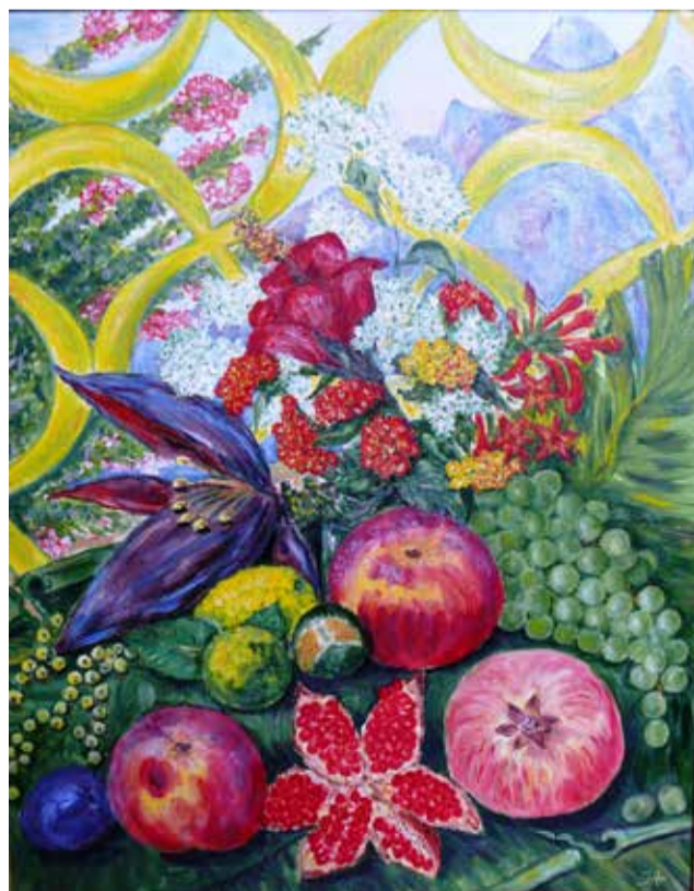
«Радость цвета», 2015 год